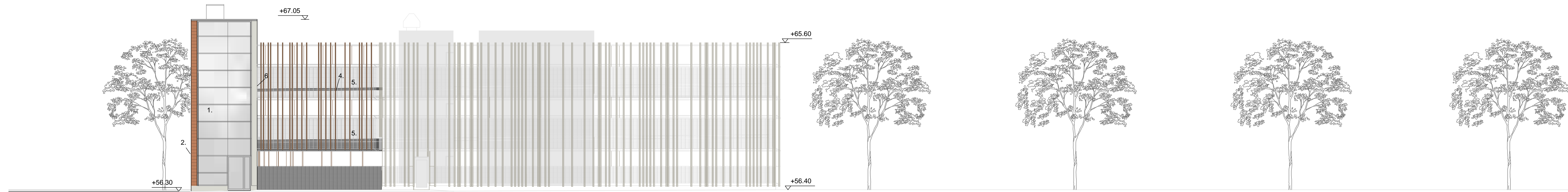
JULKISIVU KOILLISEEN (LÄÄKÄRINKUJALLE)