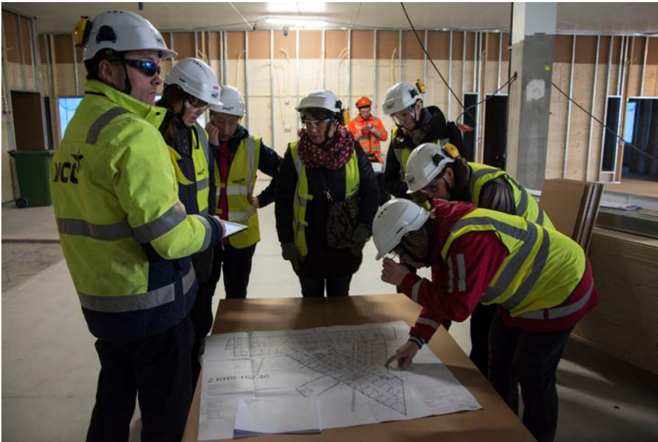
Toisessa kerroksessa mielenterveys- ja päihdeyksikön huonetilojen rakennustyöt ovat käynnissä. (kuva 3).