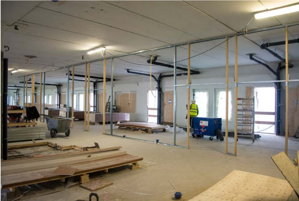
Neljännän kerroksen akuuttiosaston väliseinätyöt ovat käynnissä (Kuva 5).