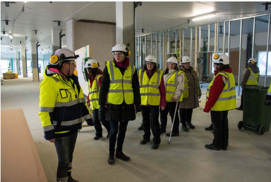
Avosairaanhoidon tiloissa toisessa kerroksessa on käynnissä mm. väliseinien asennustyöt (kuva 2). Käyttäjää eri yksiköistä oli mukana työmaakerroksella tutustumassa tiloihin.