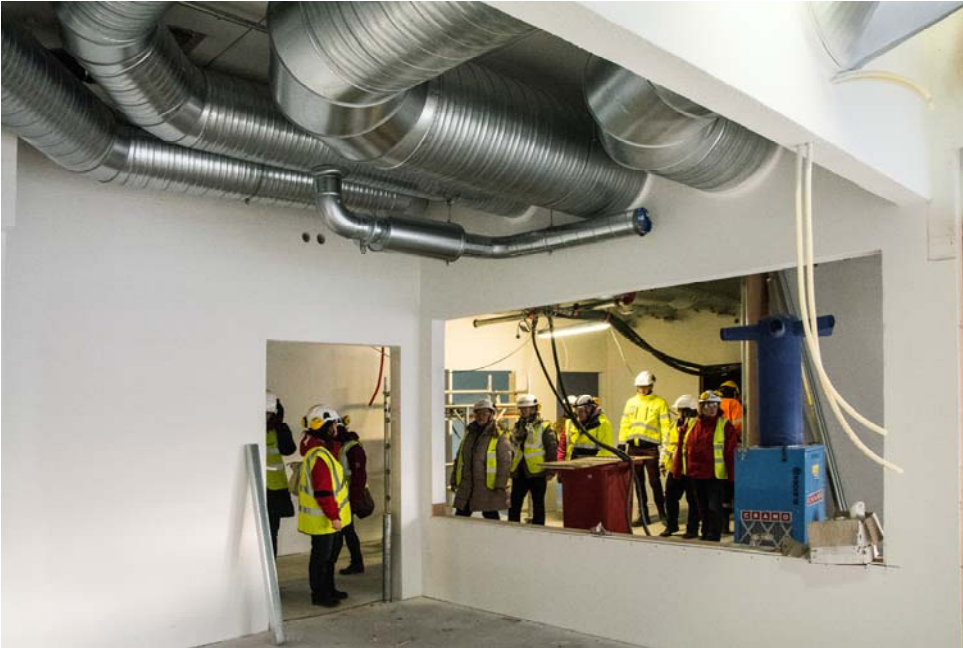
Hallinnon tiloissa ilmastointiin liittyvät asennukset ovat päätelaitteita vaille valmiit. (kuva 3).