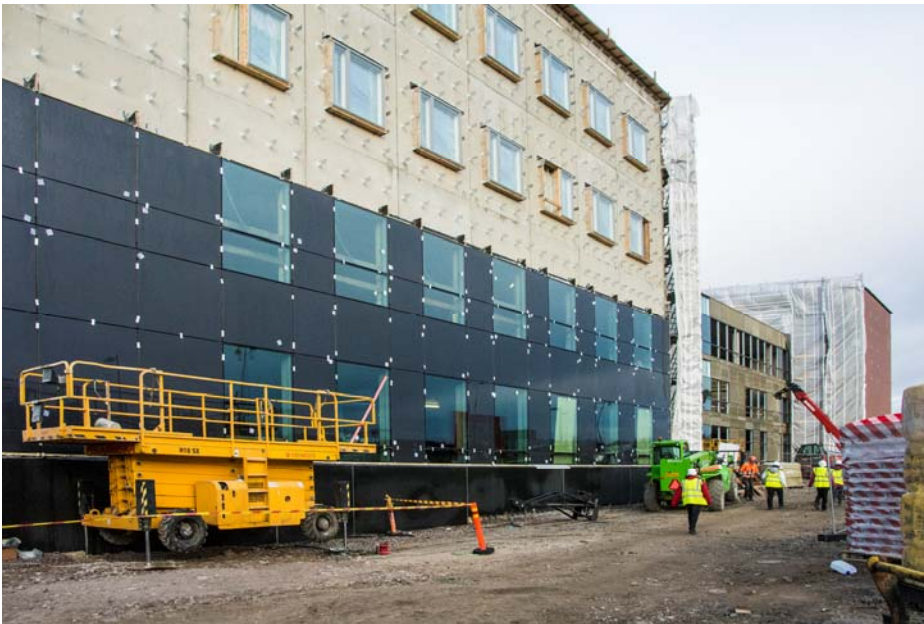
Helsingintien julkisivun metallilasiseinän asennukset jatkuvat edelleen (kuva 1). Tiililankkuverhouksen asennustyöt ovat käynnissä Myllypolun puolella.