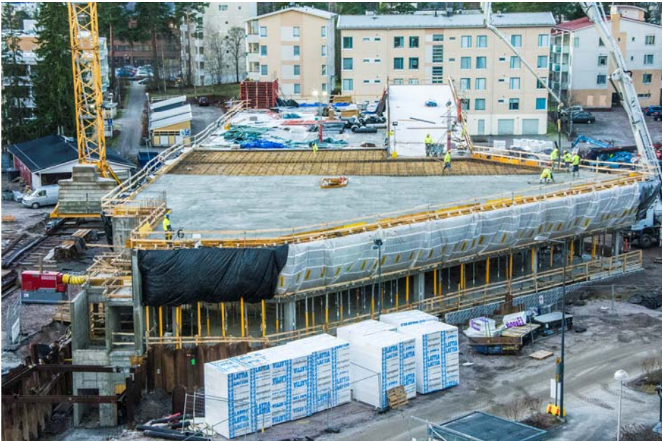
Pysäköintilaitoksella valetaan viimeistä holvia, kuva Myllynkulman katolta (Kuva 5).