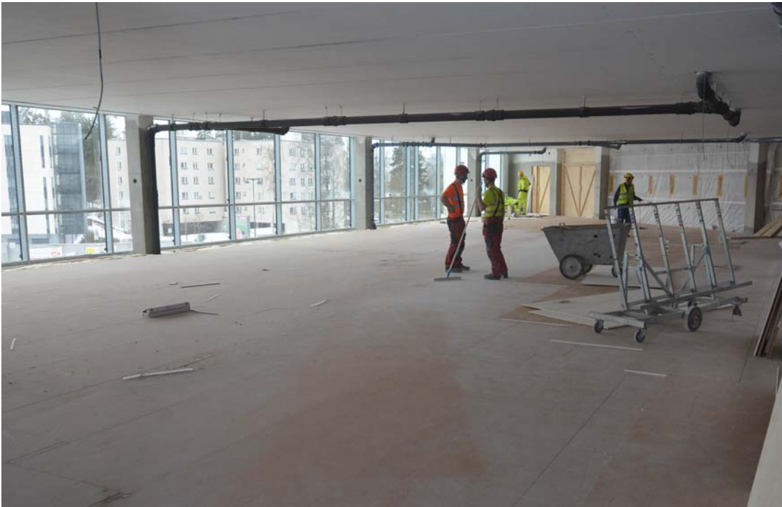
Kolmannessa kerroksessa sisääntuloaulan yläpuolisen puuvälipohjan viimeistelytyöt ovat käynnissä (kuva 3).