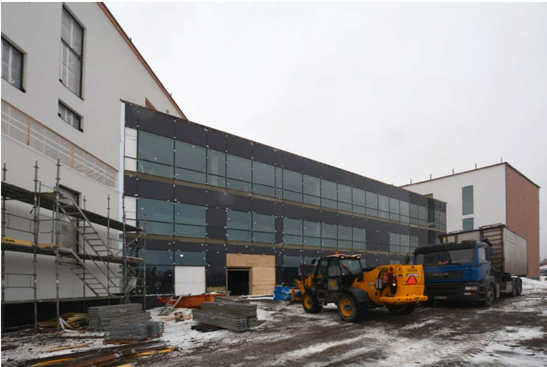
Helsinginkadun puolella metallilasiseinät on asennettu paikalleen ja rappaustyöt ovat valmistuneet (kuva 1).