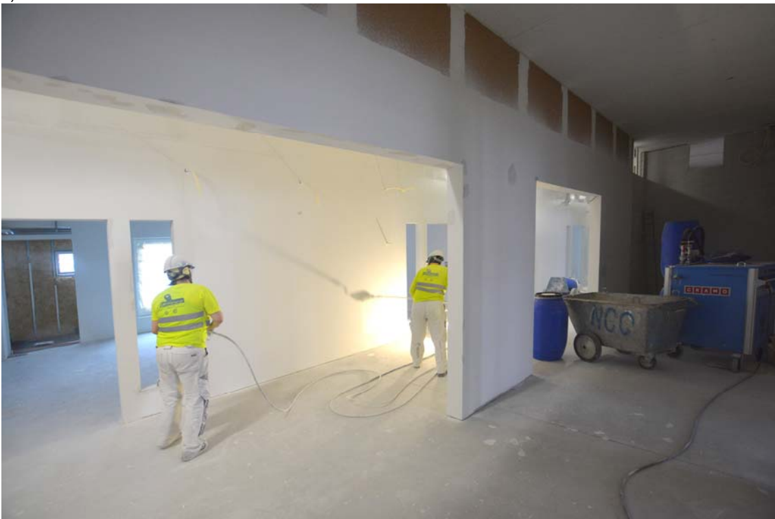
Akuuttiosaston tiloissa neljännessä kerroksessa seinien maalaustyöt ovat käynnissä (kuva 4).