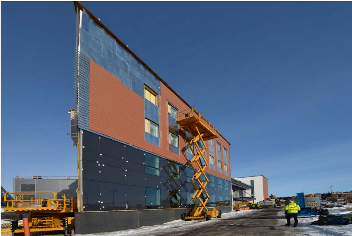
Tiililankkuverhouksen asennustyöt ovat valmiit Myllypolun puolella. Asennukset muilla julkisivuilla jatkuvat (kuva 1).