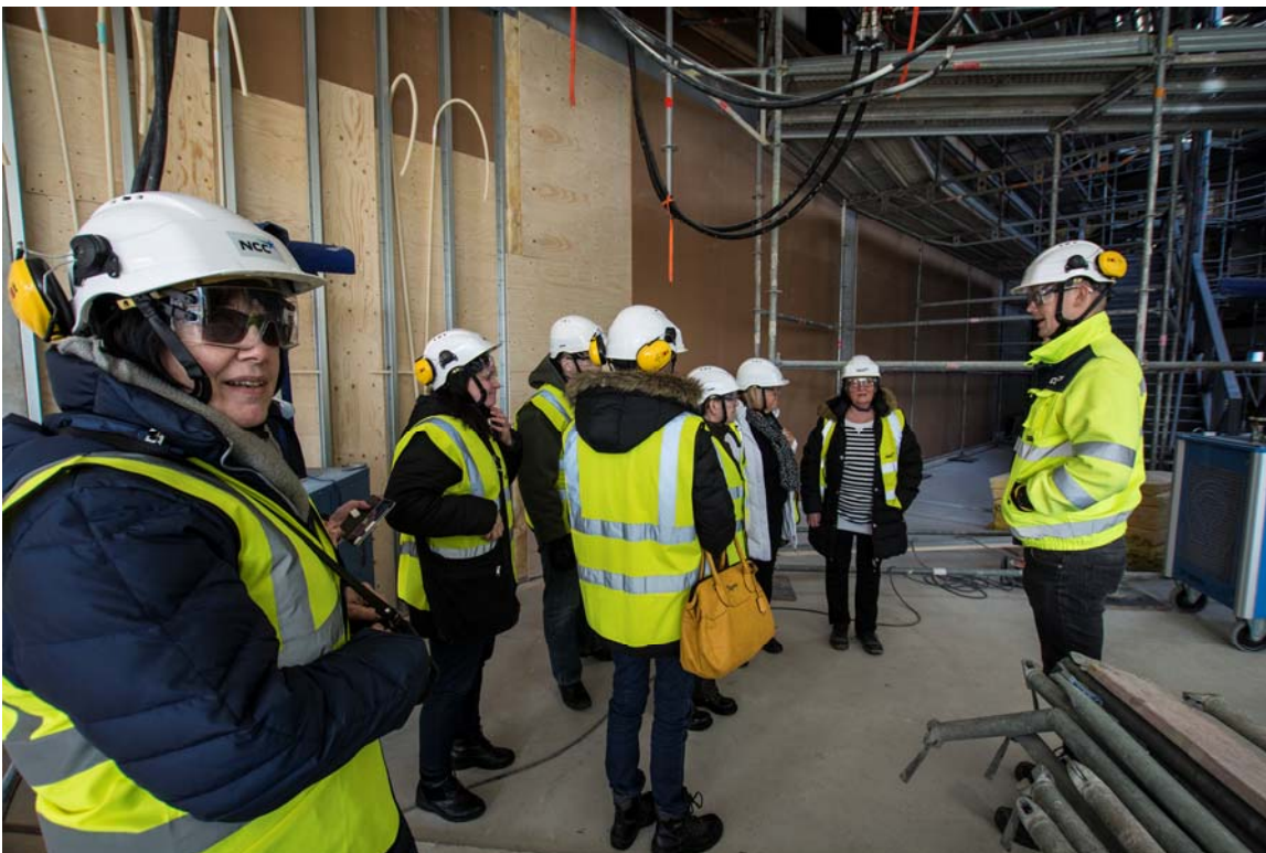
Ensimmäisessä kerroksessa väliseinätyöt ovat käynnissä. Kuvassa on tulevia käyttäjiä Järvenpään kaupungin eri palvelualueilta tutustumassa tiloihin (kuva 2).