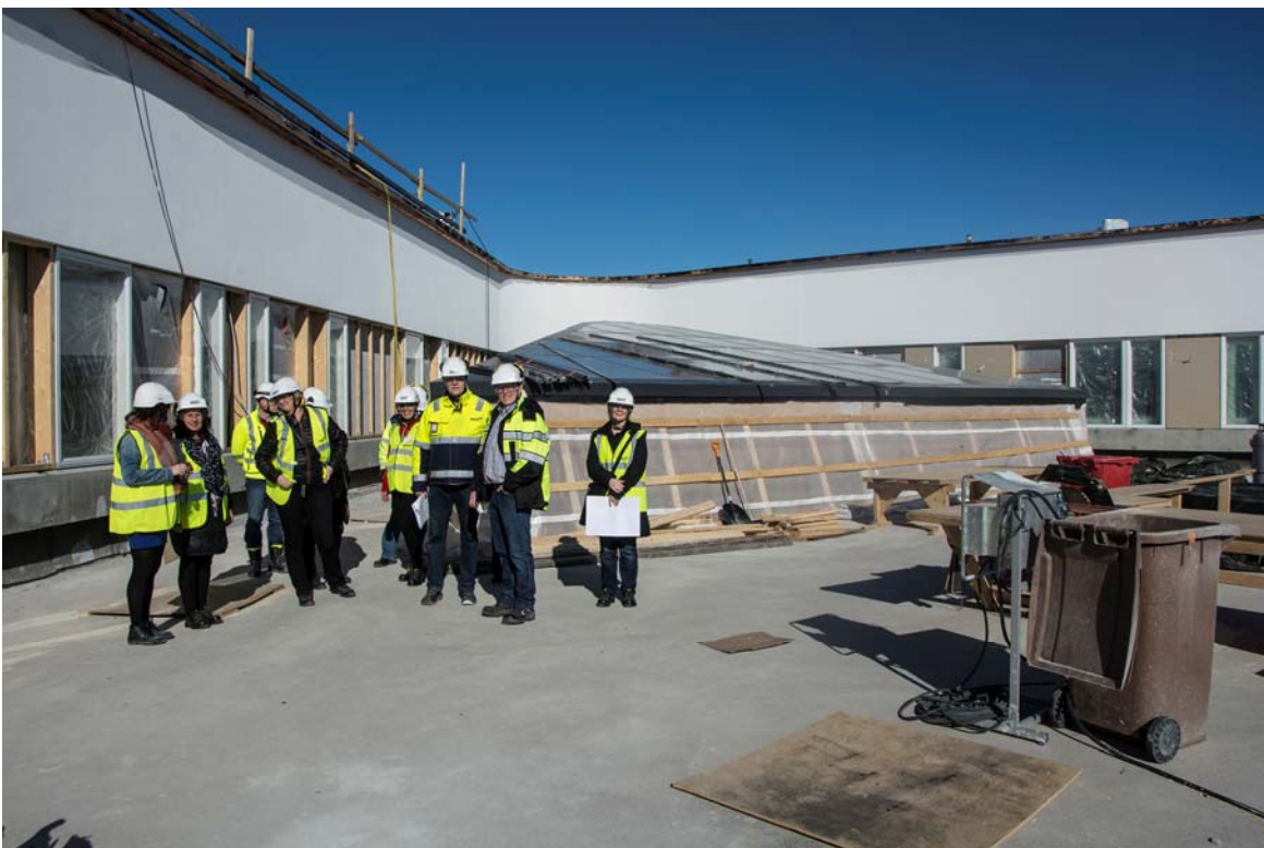
Neljännän kerroksen ulkoiluterassilla tulevia työntekijöitä avosairaanhoidosta, ravitsemuspalveluista, sairauden hoidosta, päivystyksestä ja akuuttiosastolta (kuva 2).