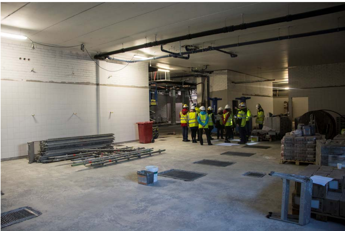
Keittiössä laatoitustyöt ovat käynnistyneet (kuva 4).