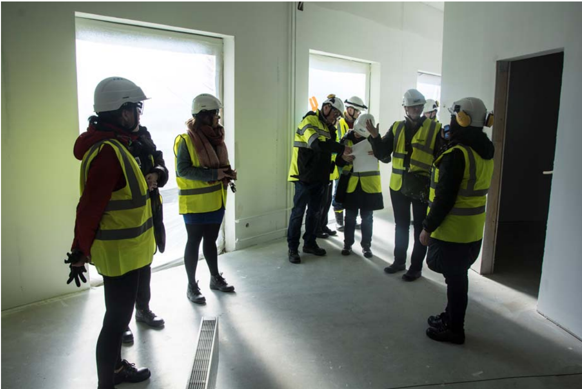
Vierailulla tutustuttiin eri tiloihin. Kuvassa avosairaanhoidon tulevia toimistotiloja toisesta kerroksesta (kuva 3).