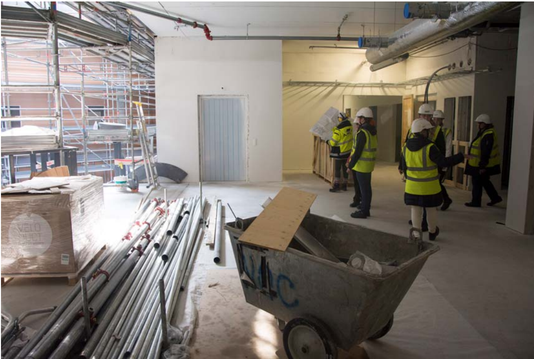
Toisessa kerroksessa sijaitsevassa odotusaulatilassa rakennustyöt ovat käynnissä (kuva 3).