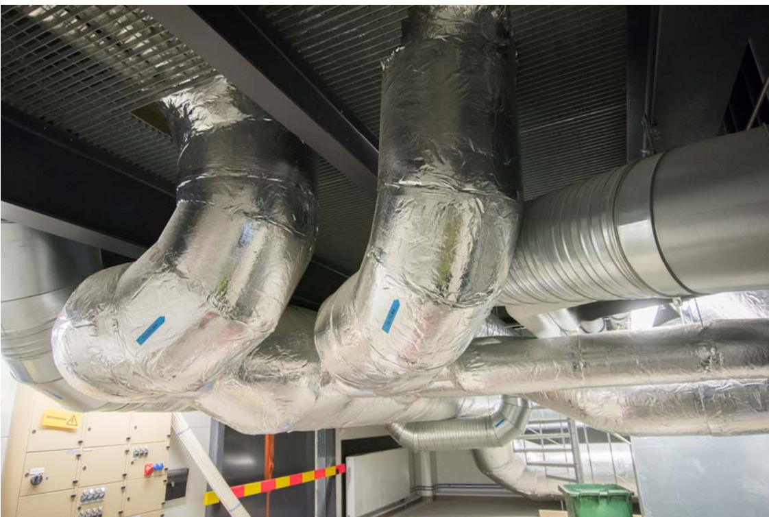
Kuvaa ilmastointijärjestelmästä (kuva 4).