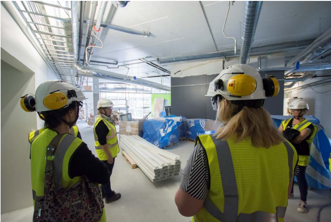
Käyttäjät tutustumassa toisen kerroksen odotustiloihin (kuva 5).