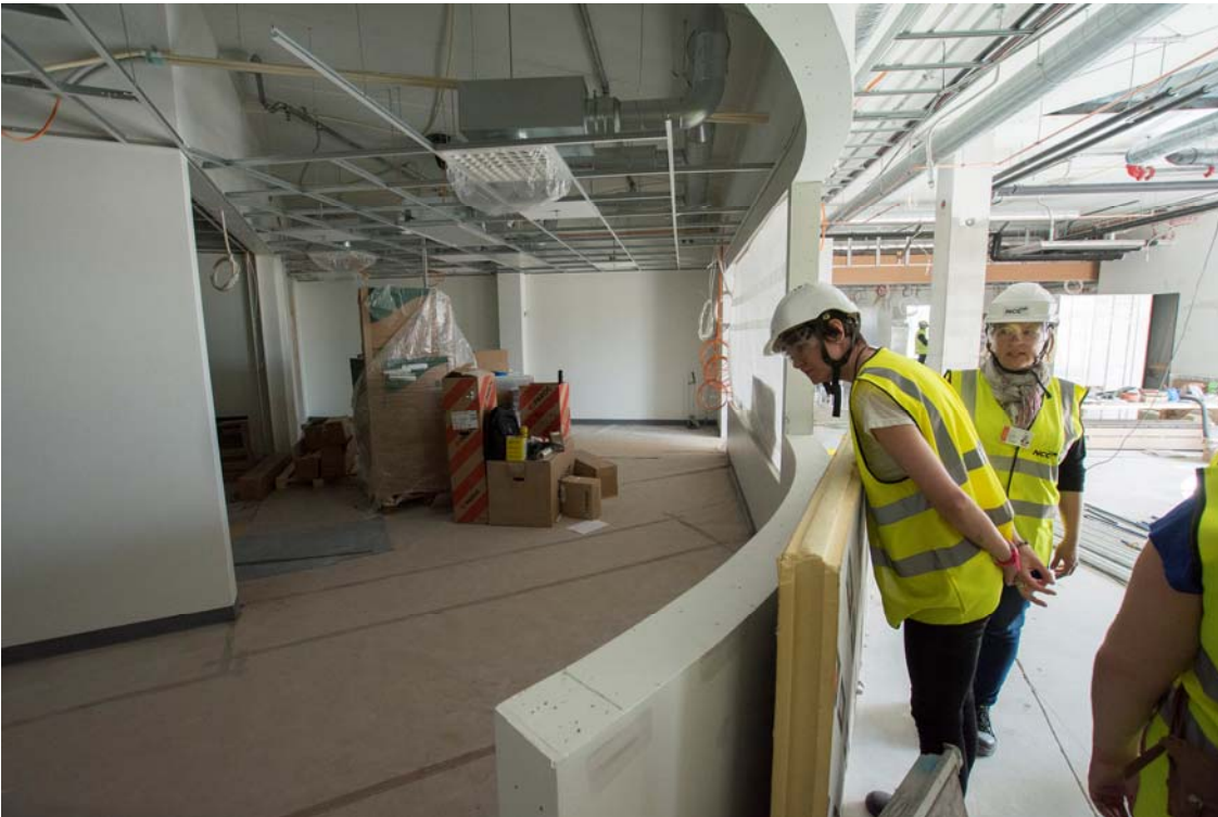
Rakenteilla oleva kansliatila neljännessä kerroksessa. (kuva 3).