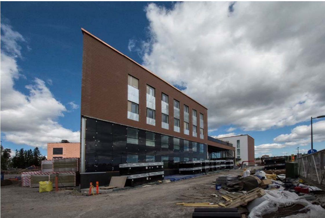
Julkisivutyöt ovat edistyneet hyvin. Kuparikasettien asennustyöt ja räystäspellitystyöt ovat käynnissä (kuva 1).