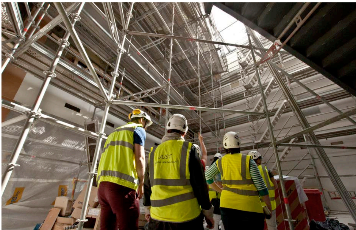
Rakennustelineitä pääaulassa. Kuvassa ylhäällä näkyy valokate (kuva 4).