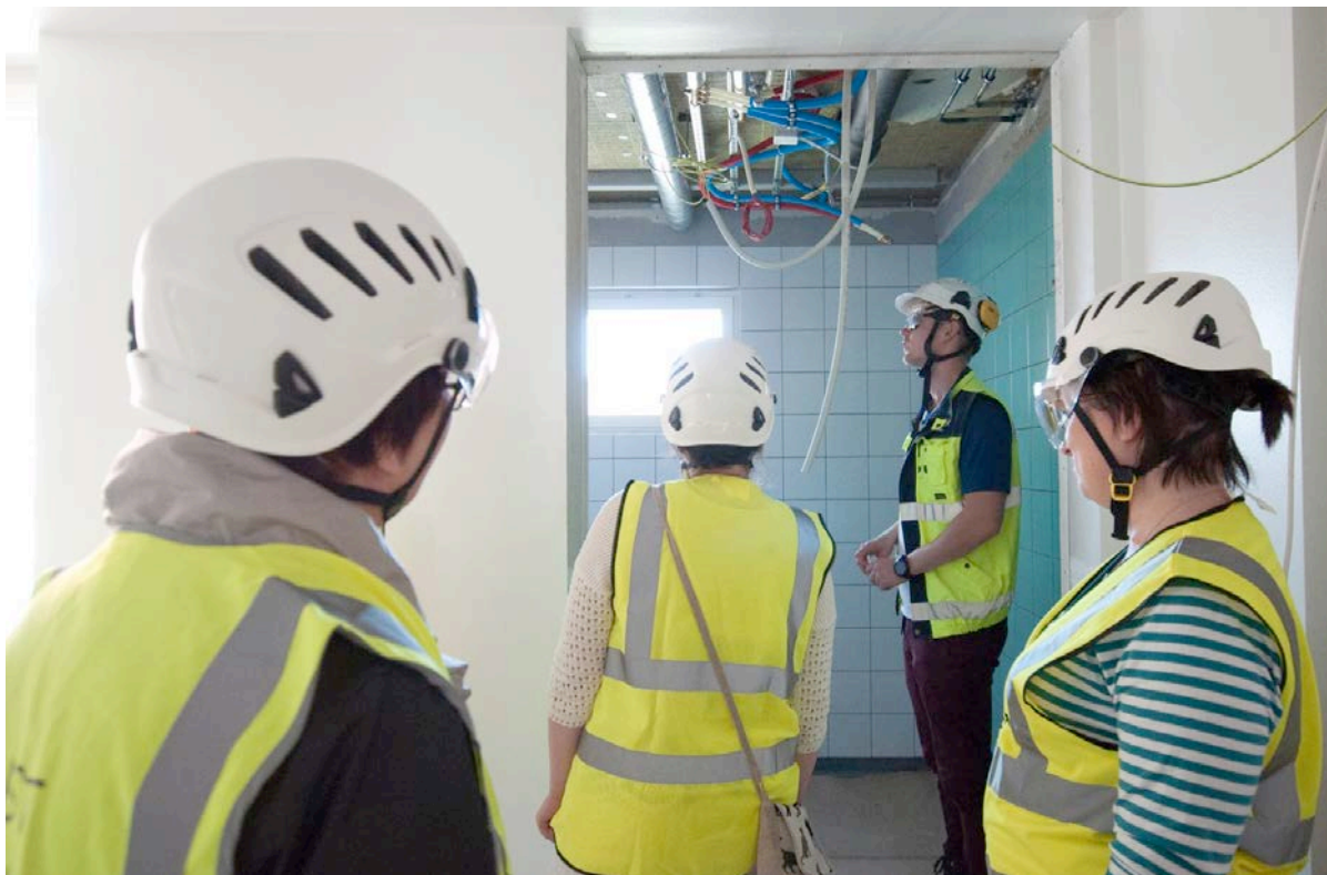
Kosteiden tilojen laatoitustyöt ovat edenneet (kuva 3).