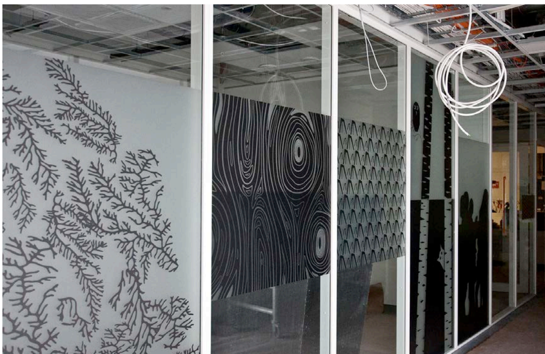
Sisustuslevyasennukset ovat myös käynnissä (kuva 4).