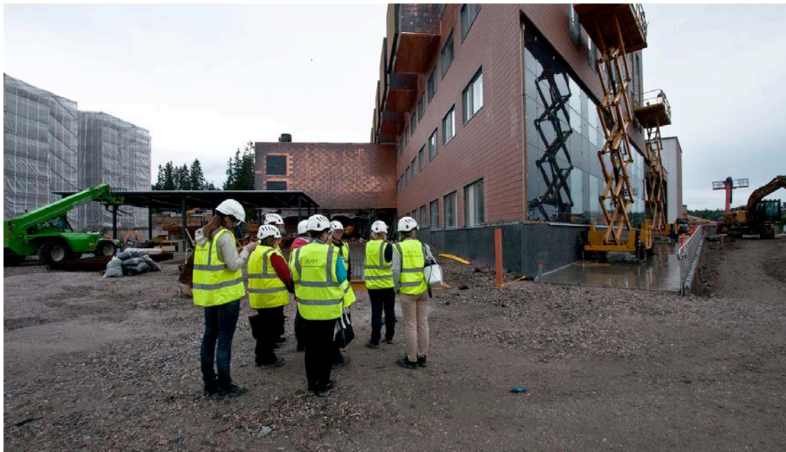
Käyttäjiä tutustumassa julkisivun kuparikasettien asennustöihin (kuva 1).