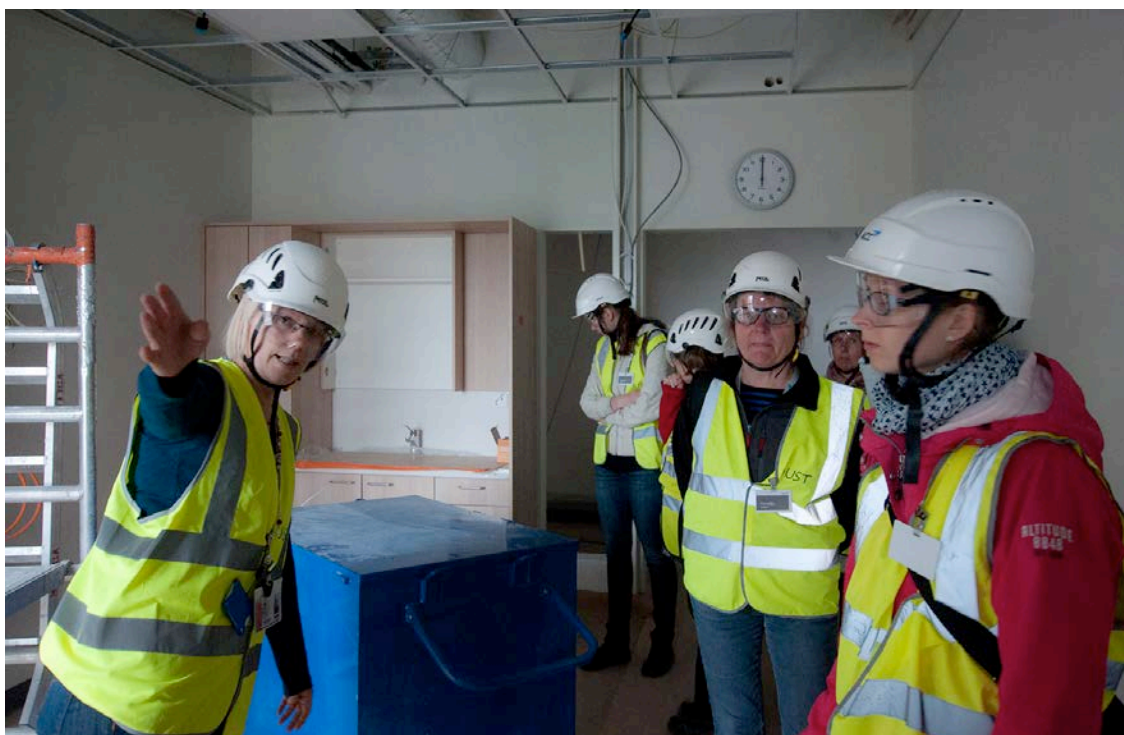
Kalusteasennukset ovat käynnissä akuuttiosastolla (kuva 2).