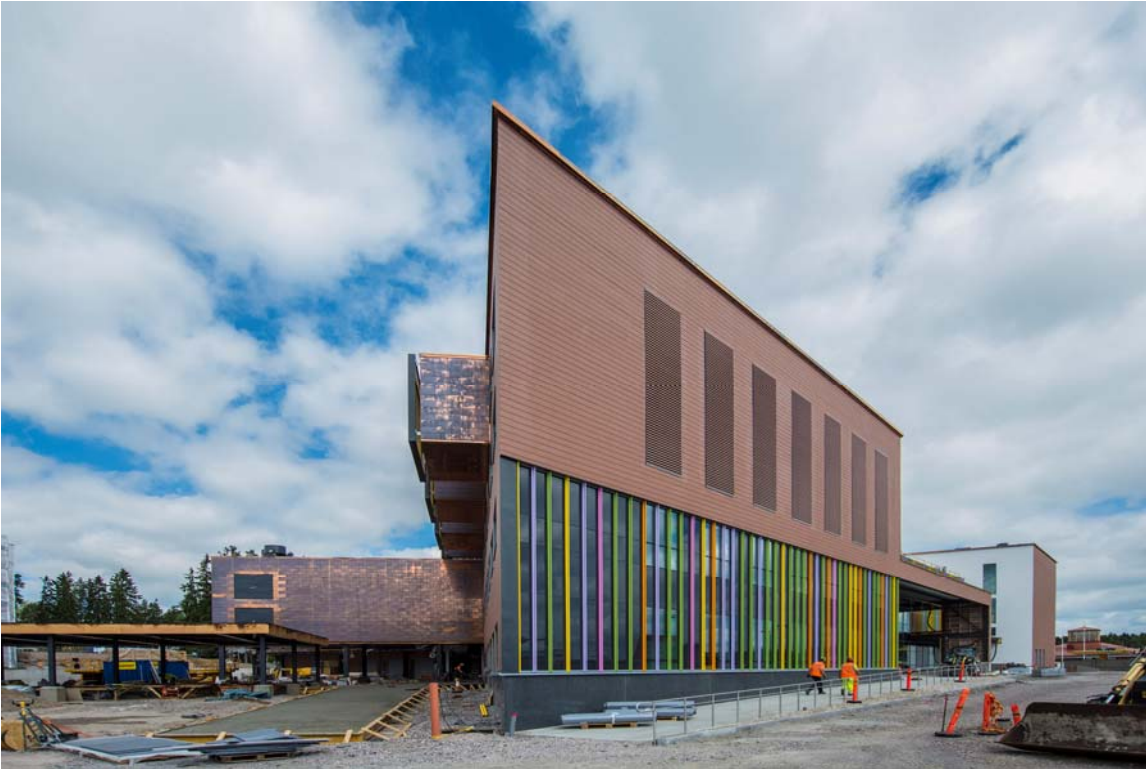
Julkisivusäleiden asennustyöt ovat käynnissä (kuva 1).