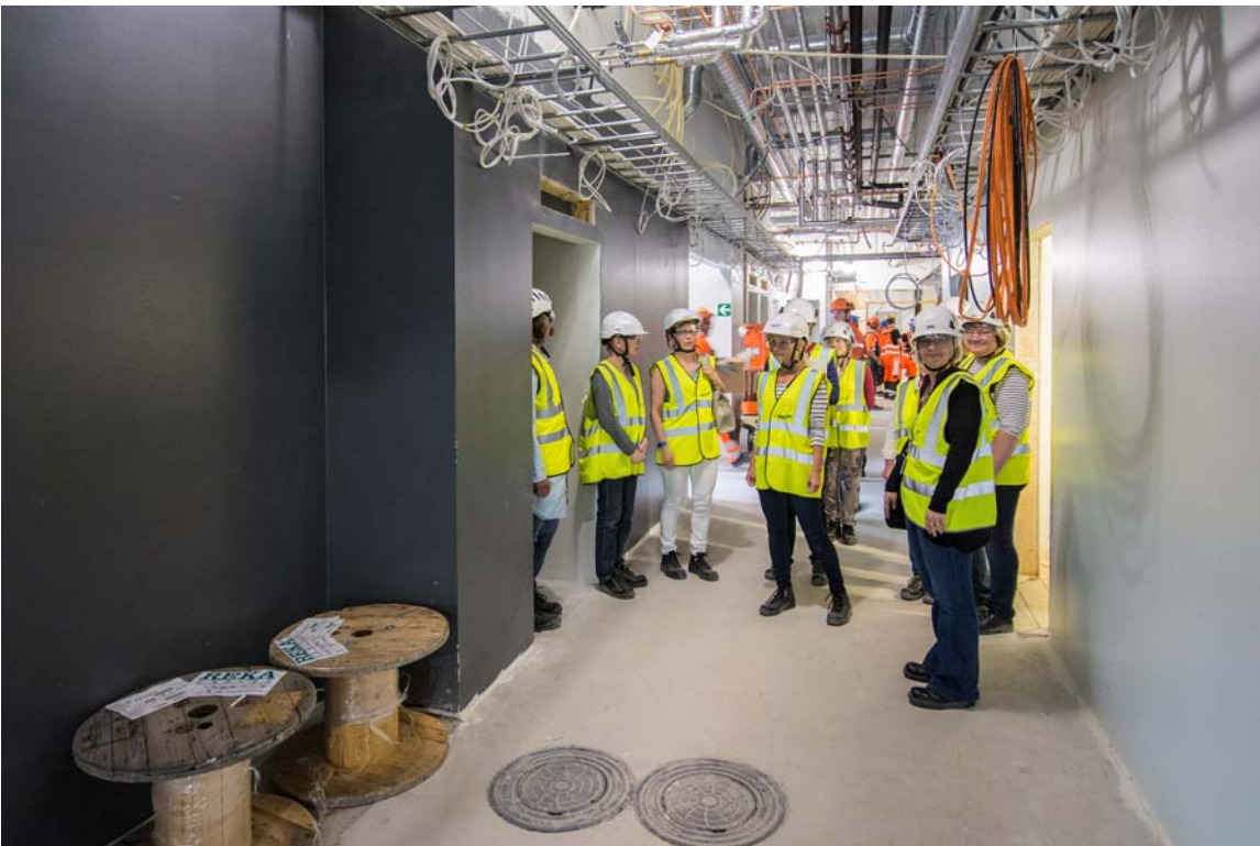
Käyttäjiä JUSTin ensimmäisessä kerroksessa tutustumiskierroksella (kuva 2).