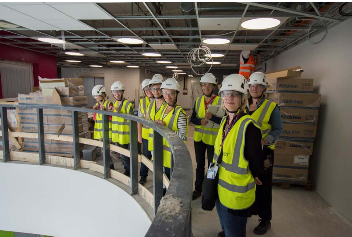
Käyttäjiä 3.kerroksen odotustiloissa, josta avautuu näkymä alakertaan. Mattotyöt ovat pääosin valmiit 3. ja 4. kerroksen tila-alueilla (kuva 4).