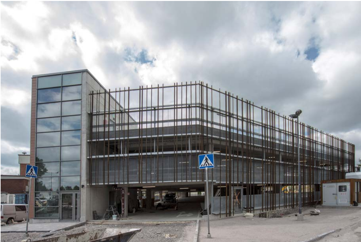
Parkkihallin työt ovat pitkällä (kuva 5).