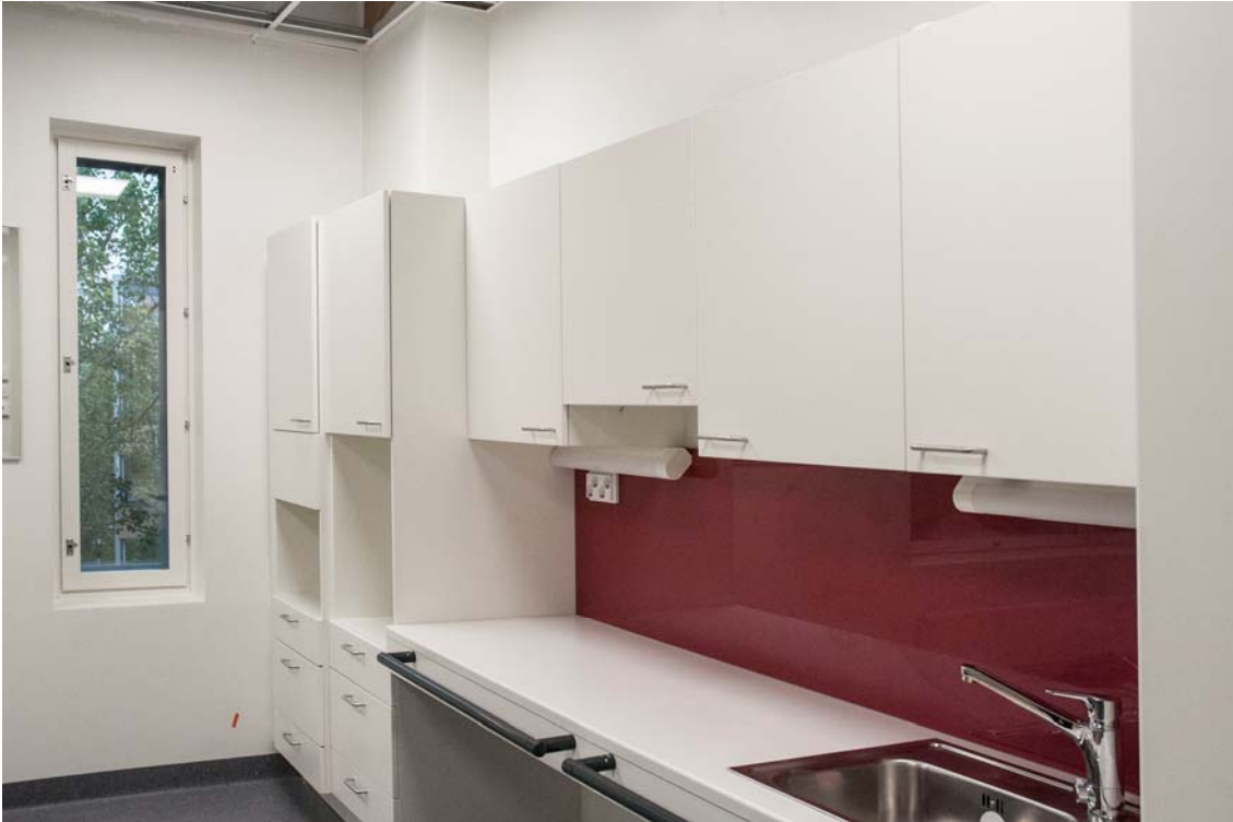
Kiintokalusteasennukset ovat valmiit ensimmäistä kerrosta lukuun ottamatta. (kuva 3).