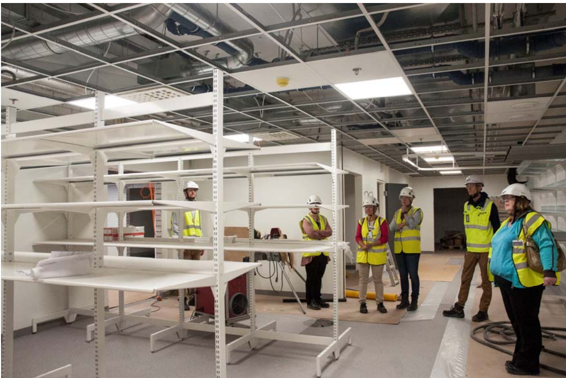
Käyttäjät tutustumassa kalusteratkaisuihin (kuva 4).