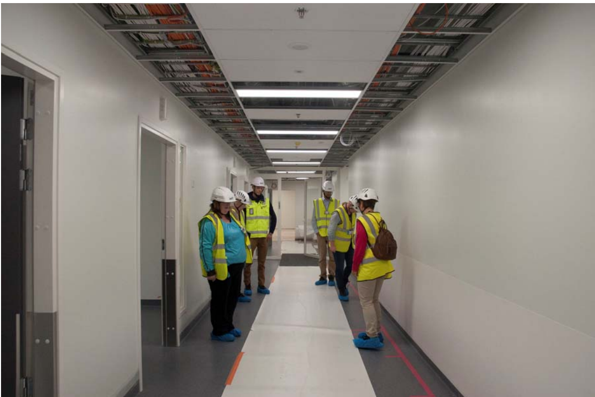
Lattiat on suojattu useassa tilassa rakennustöiden aikana (kuva 2).